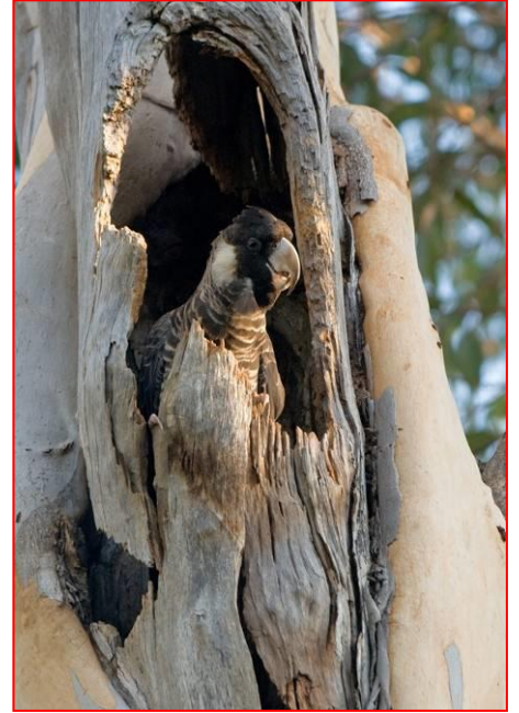
أنثى كوكاتو بوندين في العش