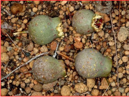
جوز المرّي ممضوغا من قبل كوكاتو بوندين