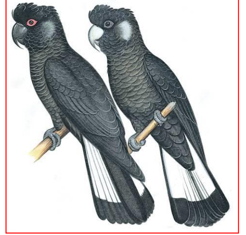
أنثى (يمين) ، ذكر (يسار)

غابات اليوكالبيت الجنوبية التي تنمو فيها اشجار الجرا والمري والكري خاصة. وتتغذى على بذور الكينا والبانكزيا والهاكيا واشجار التفاح والاجاص المثمرة. وتتغذى أيضا على الرحيق والبراعم والأزهار وشرائح لحاء الأشجار الميتة بحثا عن يرقات الخنفساء. والأعلاف المتواجدة في كافة المستويات من المظلات الى الأرض.